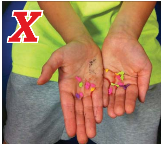
Dirty hands hurt the pages. Las manos sucias dañan las páginas.