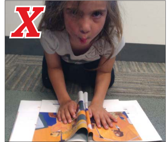
Squishing hurts the pages. Apretar el libro daña las páginas.