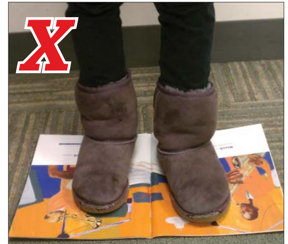
Standing hurts the spine. Pararse sobre el libro daña las páginas y el lomo.